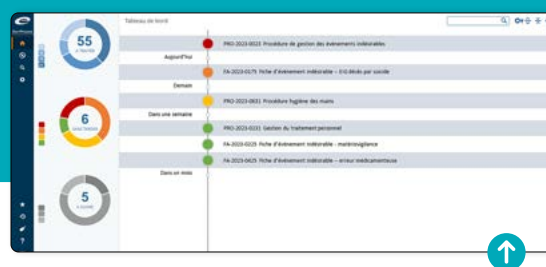
Copie d'écran du tableau de bord ENNOV

Pour ce faire, un énorme travail de recensement puis de toilettage des documents existants va devoir être mené par chaque service/direction pour intégrer dans ce nouveau logiciel les documents actuellement stockés sur des sharepoints, espaces partagés ou disques durs d'ordinateurs.