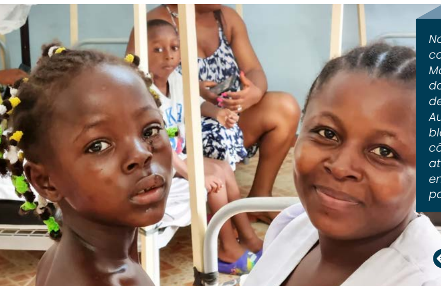
L'association « Les enfants du noma » redonne le sourire aux familles.

Nos missions de chirurgie maxillo-faciale consistent à opérer les enfants atteints de malformations faciales congénitales telles que les fentes labio-palatines et les fentes faciales rares, des séquelles de brûlures, des séquelles de noma... ainsi que les adultes présentant des tumeurs osseuses du massif facial telles que des améloblastomes, des tumeurs de la parotide, des tumeurs endobuccales, des tumeurs cutanées... En résumé, toute la chirurgie du visage et du cou. La mission est également l'occasion de renforcer les compétences des équipes locales par la réalisation d'enseignements théoriques et pratiques. Ces 15 journées de missions sont très intenses, parfois déstabilisantes mais toujours très enrichissantes !