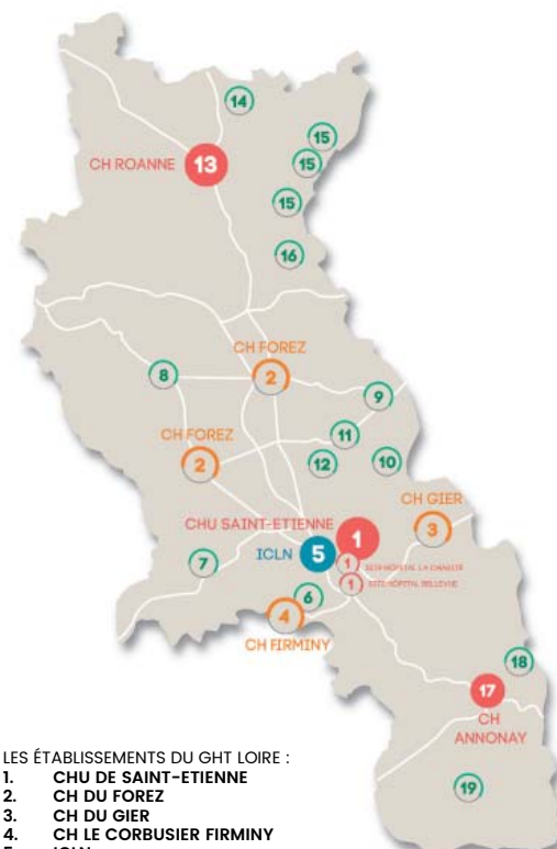
LES ÉTABLISSEMENTS DU GHT LOIRE :

Cet appel à projet fait l'objet d'une contractualisation avec l'ARS pour s'assurer de la mise en œuvre effective des projets avec des échéances de suivi fixées jusqu'à la fin de l'année 2018.