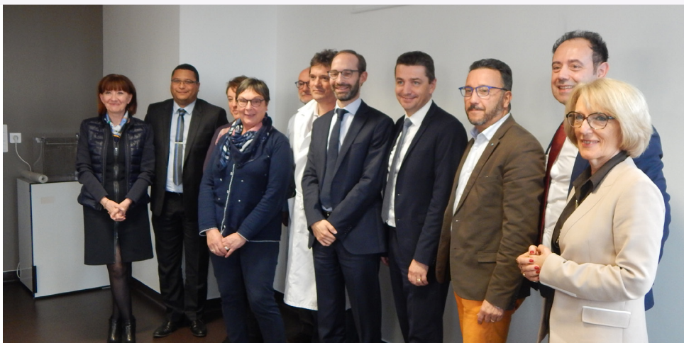
Le directeur général du CHU de Saint-Etienne, le directeur par intérim de la direction commune entre le CH de Roanne et les EHPAD de Coutouvre, Montagny et Pays de Belmont, les présidents de conseil de surveillance du CHU de Saint-Etienne et du CH de Roanne, les présidents de conseil d'administration des EHPAD de Montagny, Coutouvre, Pays de Belmont, se sont réunis jeudi 8 novembre 2018 pour la signature de la convention de direction commune, en présence du délégué territorial de l'ARS.

Elle vise à consolider et amplifier cette dynamique de coopération qui s'est notamment matérialisée par la signature d'un accord cadre en mars 2015. Au titre des coopérations fortes, il convient de citer la neu-