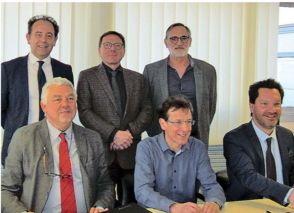
Le partenariat a été formalisé le 28 mars par la signature d'un ensemble de conventions entre les trois établissements concernés par le dispositif.

de préparation des chimiothérapies de l'ICLN. Les patients bénéficient ainsi d'une prise en charge cohérente et complète sur place, limitant les temps de trajet et la fatigue induite.