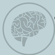
Table ronde 18h00