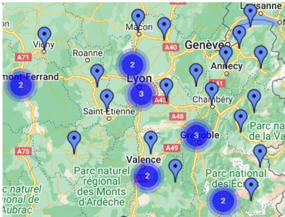
FIGURE 1 REPARTITION DES CONSULTATIONS MEMOIRE DE LA REGION AURA.

Le territoire de la CROMA (Figure 1) est composé de 47 consultations mémoire de territoire, 50 consultations mémoire de proximité et quatre CMRR.